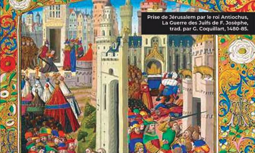
Prise de Jérusalem par le roi Antiochus, La Guerre des Juifs de F. Josèphe, trad. par G. Coquillart, 1480-85.