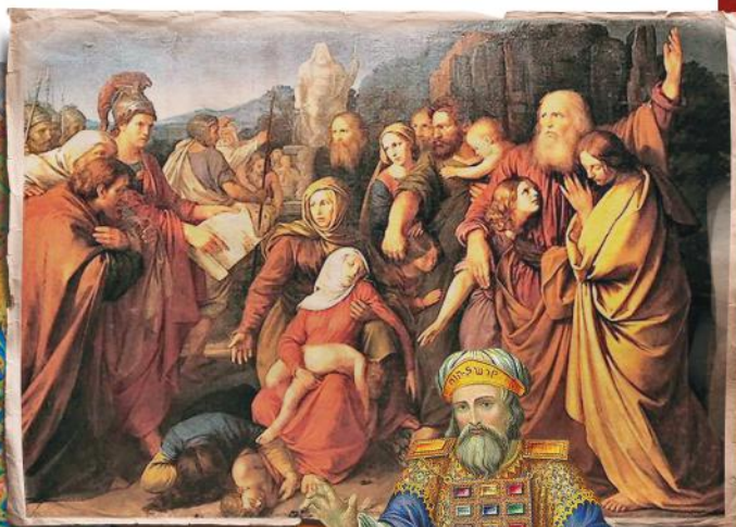
▲ La famille Maccabée, toile de Wojciech Stattler - 1844 Musée national de Cracovie - Pologne